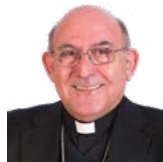
Mons. Casimiro López Llorente