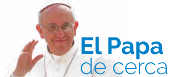
Papa Francisco Evangelizar

XXIX Domingo del tiempo ordinario (1ª Semana del Salterio)