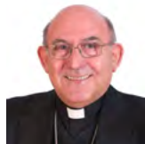
Mons. Casimiro López Llorente