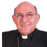
Mons. Casimiro López Llorente